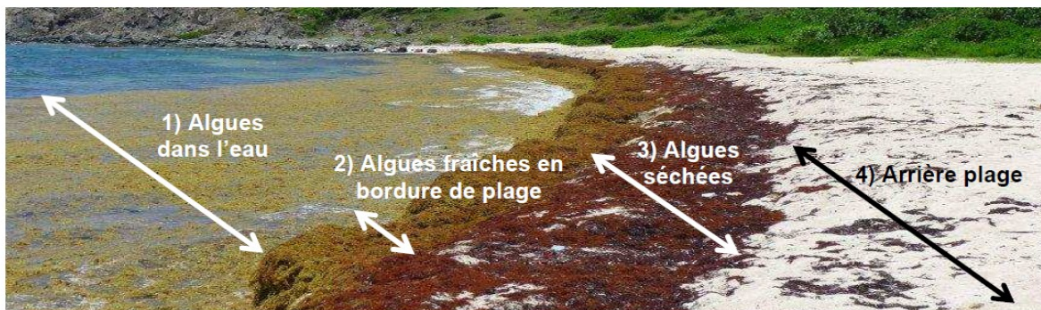
Sargasses échouées sur une plage

• À terre : ramasser les algues fraîches de couleur "brun clair" en bordure de plage, manuellement ou de façon mécanisée (si nécessaire)*. Ce ramassage libère la bordure de plage permettant ainsi la remontée progressive des algues précédemment bloquées dans l'eau. Les algues plus hautes sur la plage, sans contact avec l'eau et aérées, sèchent rapidement et prennent une coloration plus foncée.